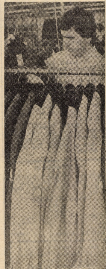
Control interfazic al confecțiilor la întreprinderea „Steaua Roșie” Sibiu.