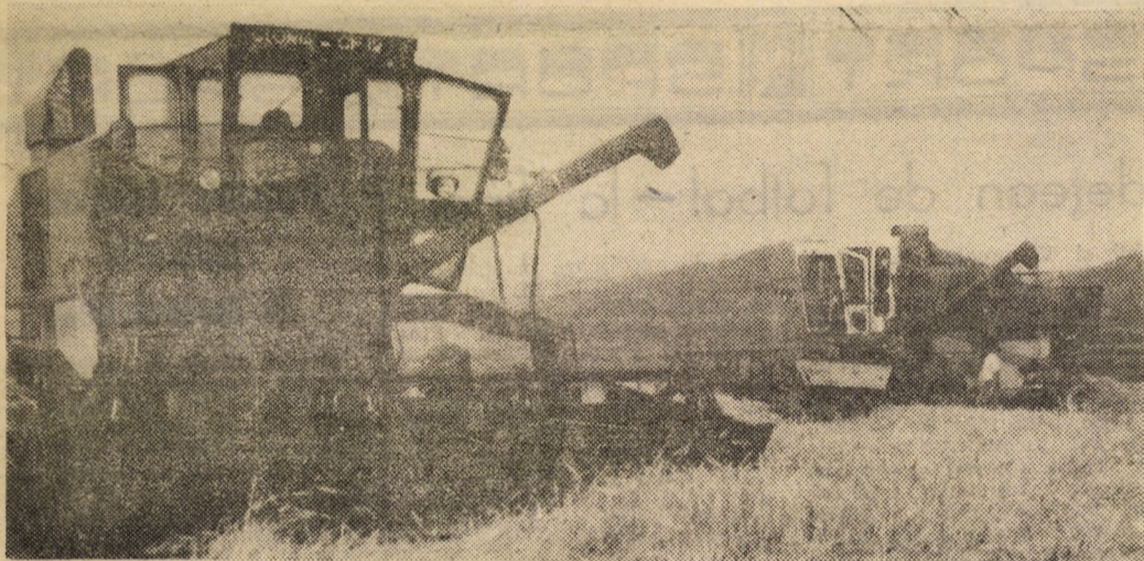
Momente fierbinți la secerișul orzului

Continuare în pag. a III-a) I. FLESCHEAN