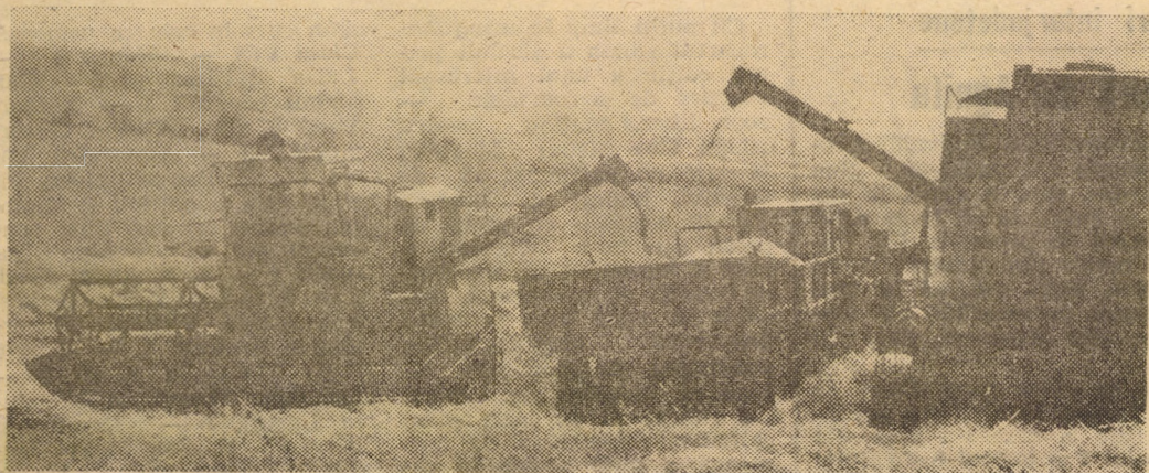
Secvență de seceriș în C.U.A.S.C. — Miercurea Sibului. Se pregătește un nou transport cu destinația — baza de recepție

Posibilitățile de documentare pentru un reportaj sînt extrem de variate. Poți, de pildă, aborda diferiți factori de decizie. Aceștia vor prezenta, cu lux de amănunte măsurile organizatorice adoptate pentru ca în cel mai scurt timp întreaga recoltă să ajungă în hambarele țării, stadiul la zi al lucrărilor, intențiile de viitor. Poți sta de vorbă cu oamenii faptelor, cu mecanizatorii. Aceștia vor demonstra că secerișul este campania lor pentru că ei au pre-