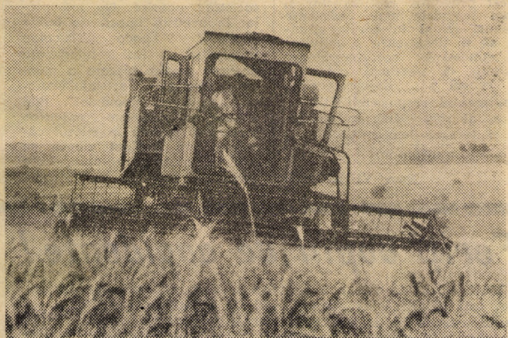
Nici un rabat calității — o cerință care trebuie să preocupe pe fiecare participant la seceriș