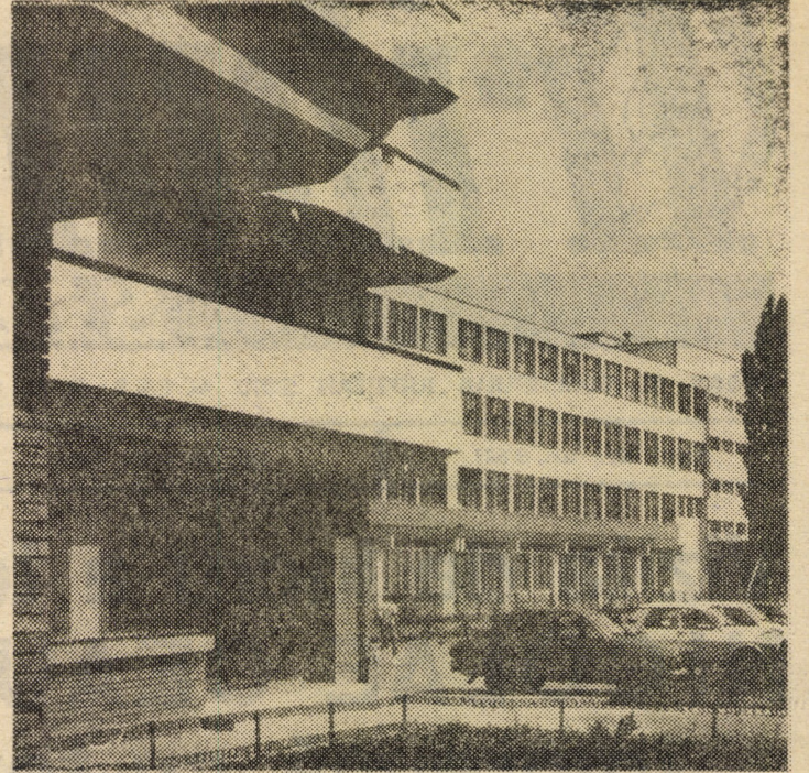
Nouă arhitectură industrială la Sibiu — Întreprinderea „Steaua Roșie”