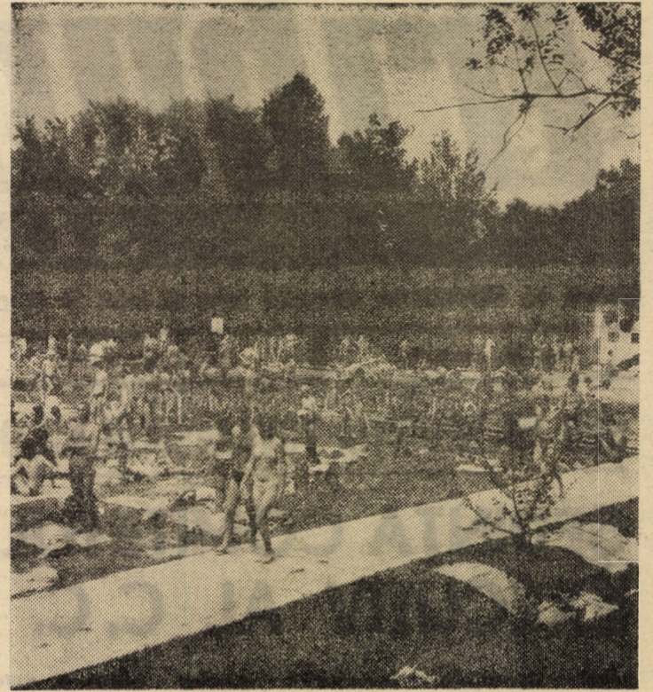
O... caldă invitație la Ștrandul tineretului din Sibiu