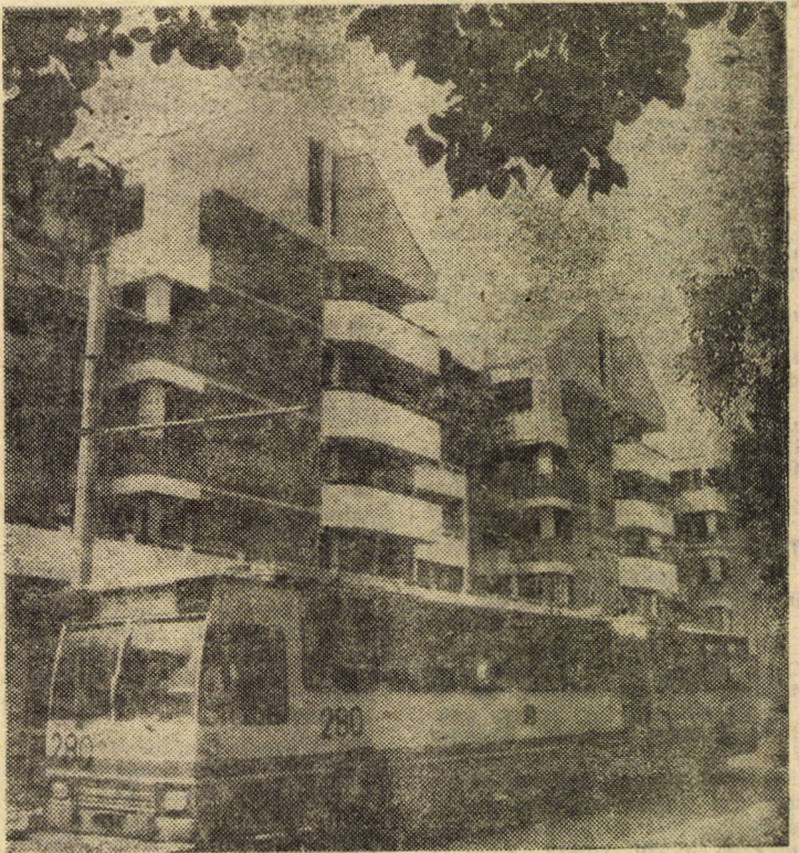
Noi construcții de locuințe în zona gării din Sibiu