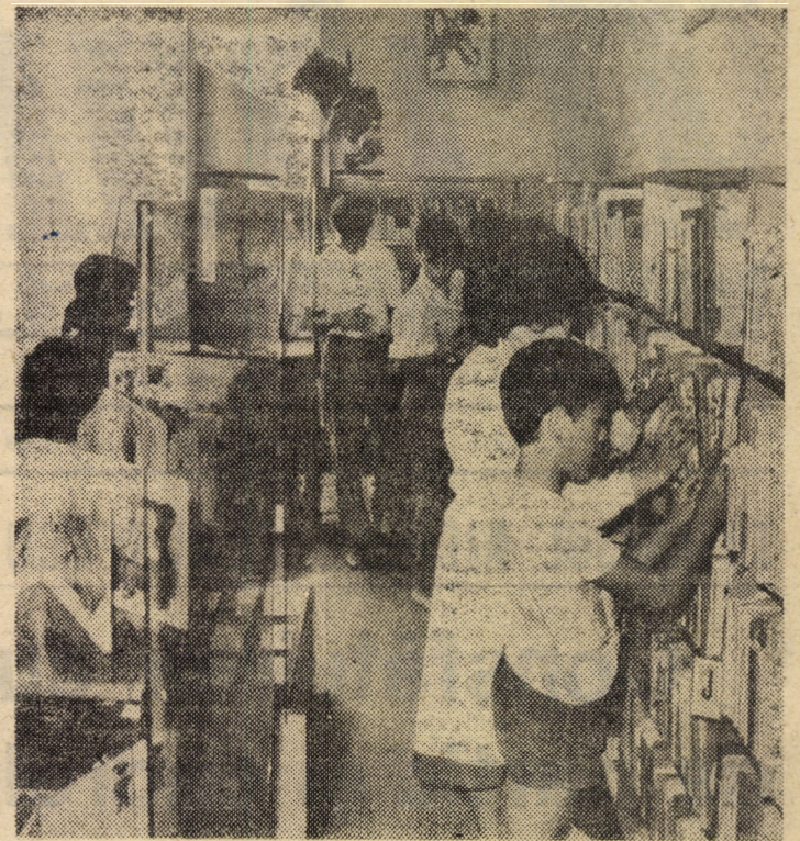
Un loc frecvent vizitat de micii cititori, mai ales pe timpul vacanței: secția pentru copii a Bibliotecii „ASTRA” din Sibiu.

Expoziția va fi deschisă, conform programului muzeului, pînă la sfîrșitul lunii octombrie.