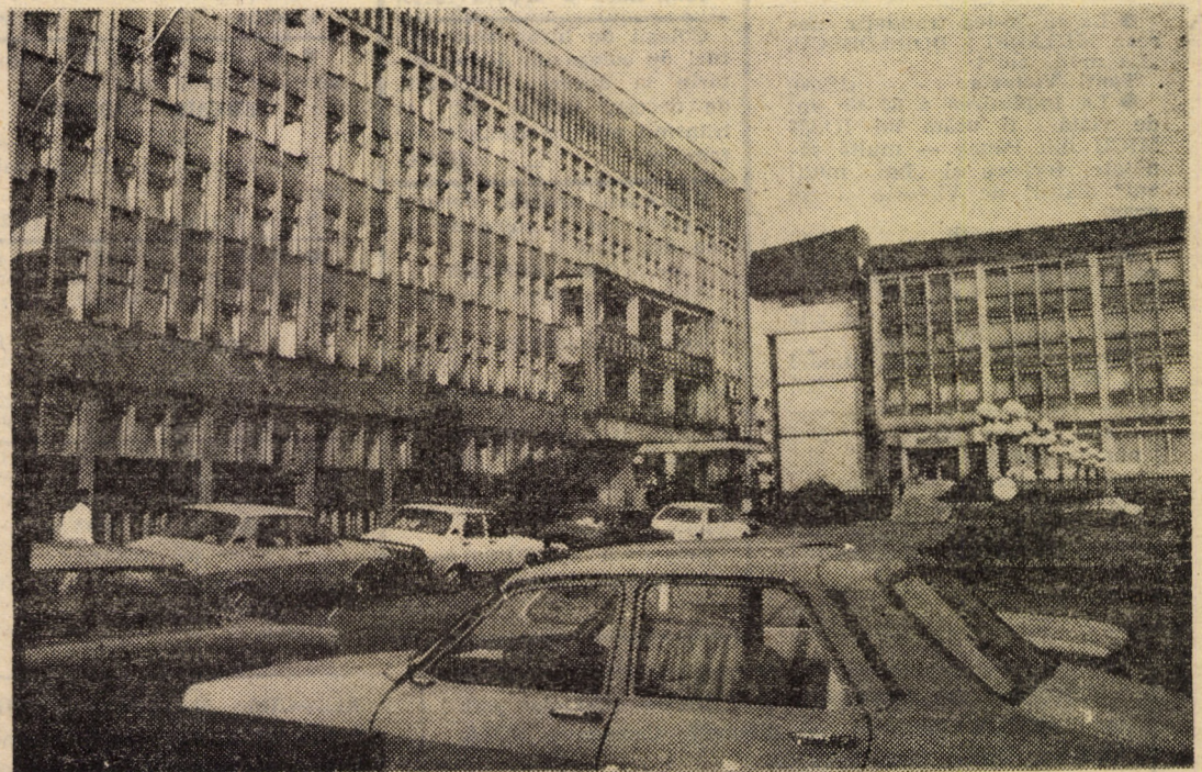
Imagine din centrul Mediașului contemporan

de 102,2 la sută), depășirea planului la piese de schimb (123,5 la sută), obținerea de economii energetice, aplicarea unor măsuri suplimentare față de cele prevăzute în programul de organizare și modernizare etc. Pe scurt, colectivul unității chiar dacă așteaptă „ajutor din afară”, mizează în primul rînd pe forțele proprii, fiind decis să nu precupească nici un efort pentru onorarea exemplară a sarcinilor de plan pe întregul an, la toți indicatorii.