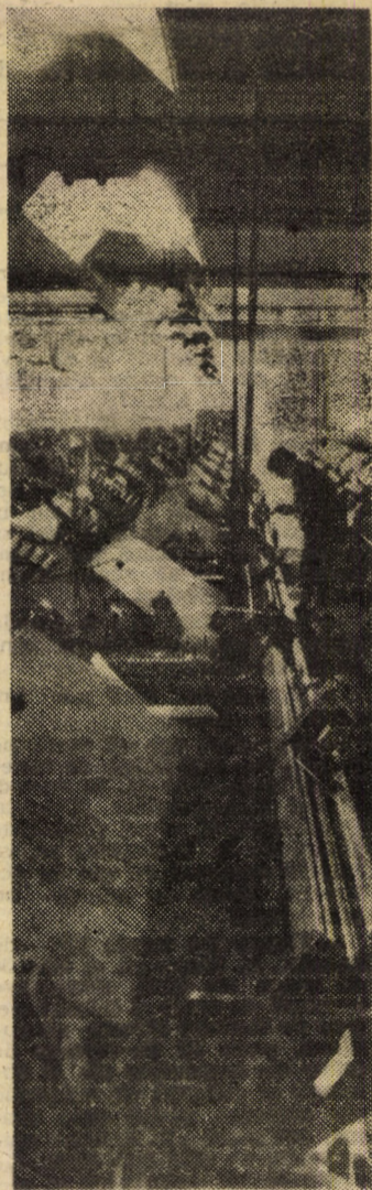
Imagine din secția țesătorie a Întreprinderii „Mătasea Roșie” Cisnădie