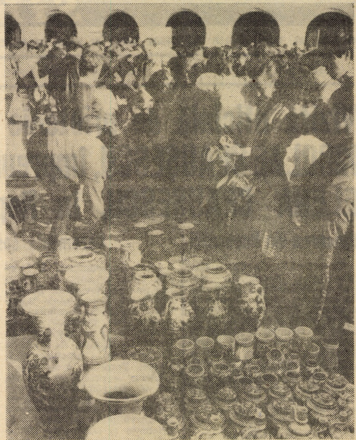
O imagine elocventă despre diversitatea pieselor prezentate la tradiționalul Tîrg al olarilor

Traian SUCIU NOTA: Marele premiu al concursului folcloric „Cîntecele munților” a fost acordat ansamblurilor „Bistrița” al Cooperativei meșteșugărești din Bacău și „Salba Prahovei” din Plopeni.