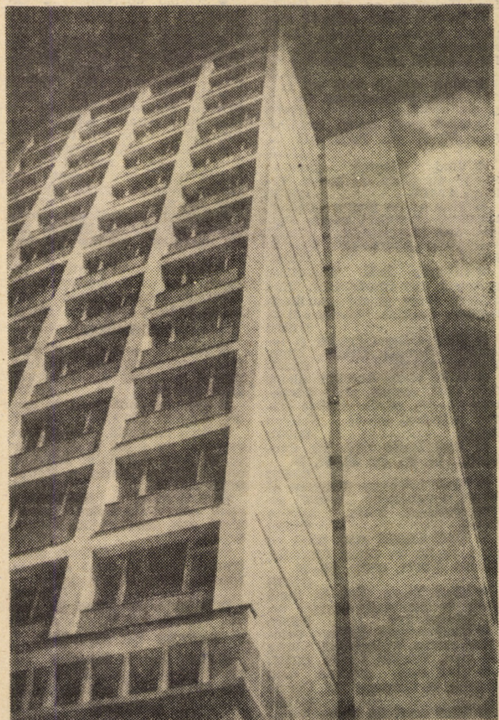
În noua arhitectură a Sibiului, Hotelul „Continental” se înscrie prin cotele înălțimii