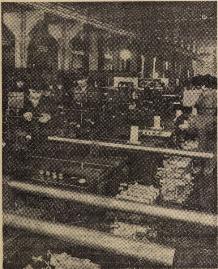
Întreprinderea Mecanică Sibiu, unde rezultatele obținute pe linia organizării producției și a muncii sint rodul activității întregului colectiv de muncă

La I.A.S. Ruja s-a declanșat semănatul orzului de toamnă. Pînă în seara zilei de 13 septembrie a.c. a fost înființată cultura pe primele 64 de hectare. După grafice lucrarea va fi finalizată pînă la 21 septembrie. Din data de 15 septembrie se va declanșa și semănatul grului de toamnă. În aceste momente „fierbinți” toată suflarea din întreprindere acționează pe toate fronturile pentru ca să încheie anul agricol cu rezultate cât mai notabile, la toate activitățile.