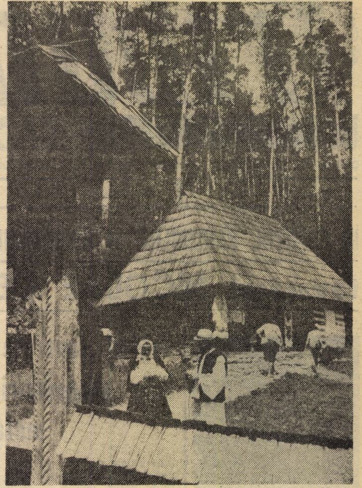
Un aspect de la Muzeul Tehnicii Populare din Dumbrava Sibului

În cel de-al patrulea capitol al lucrării, autorul ne înfățișează o instituție de larg interes pentru toți cei ce activează în domeniul dreptului, anume prescripția extinctivă. Simpla menționare a acestei instituții ne determină să credem că