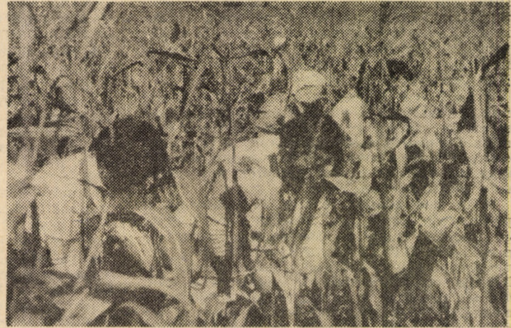
Mobilizarea tuturor forțelor satelor la recoltatul porumbului, o sarcină de maximă actualitate