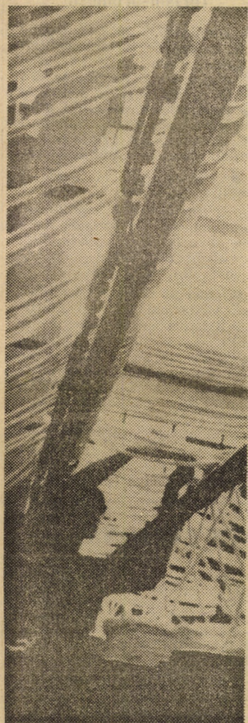
Secvență de muncă din secția filatură a întreprinderii „Tirnavă” Mediaș