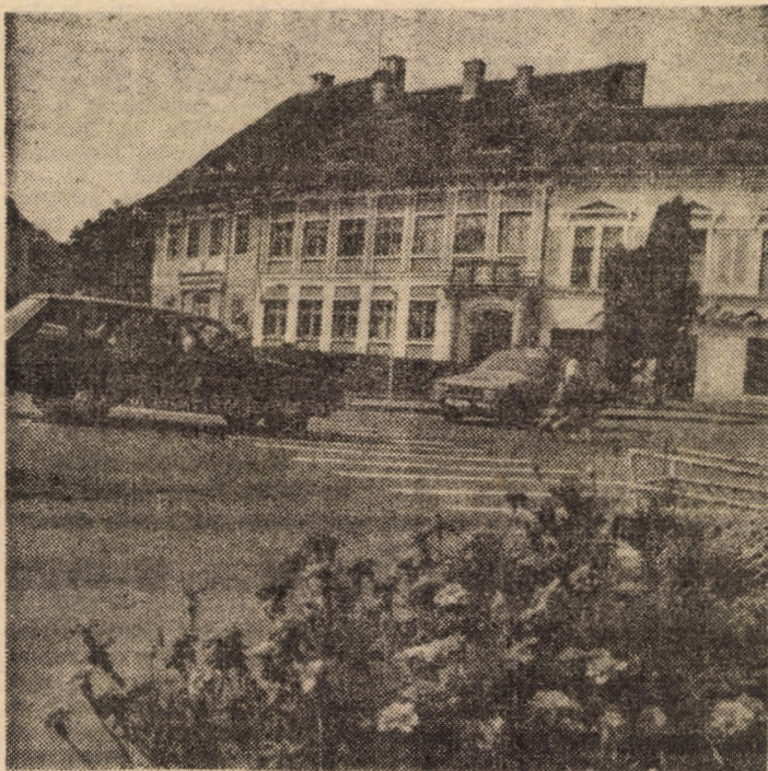
Imagine din centrul orașului Cisnădie

● VOLEI (div. B, feminin). Duminică, 30.X., de la ora 12.30, sala C.S.S. Sibiu va găzdui meciul C.S.M. Libertatea — Metalotehnica Tg. Mureș. ● BASCHET (div. A, m). Duminică, 30.X., ora 11, în sala C.S.S. din Sibiu, Balanța C.S.U. va primi replica echipei Rapid București. ● RUGBI (div. B). În 30.X., ora 10, pe terenul Valea Aurie se vor confrunta Foresta Sibiu și Petrolul Arad (fiderul seriei a IV-a a diviziei B).