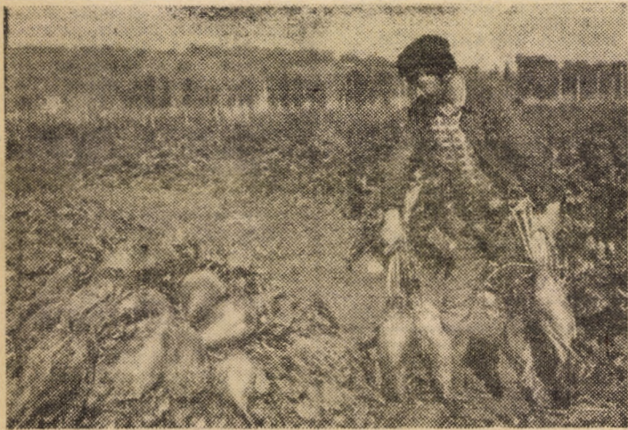
La Complexul Avicol al A.E.I. Miercurea, în recolta din acest an de sfeclă pentru furaje s-au obținut frecvent exemplare de 8 și 9 kilograme

Am prezentat această experiență deoarece unele unități crescătoare de animale nu folosesc la capacitate spațiile verzi din incinta sectoarelor zootehnice și din apropierea lor. În aceste spații, așa cum demonstrează și rezultatele de la A.E.I. Miercurea, se pot obține 2 și chiar 3 recolte pe an ce pot completa, cu bune rezultate, rezervele de furaje din cămarile zootehnice.