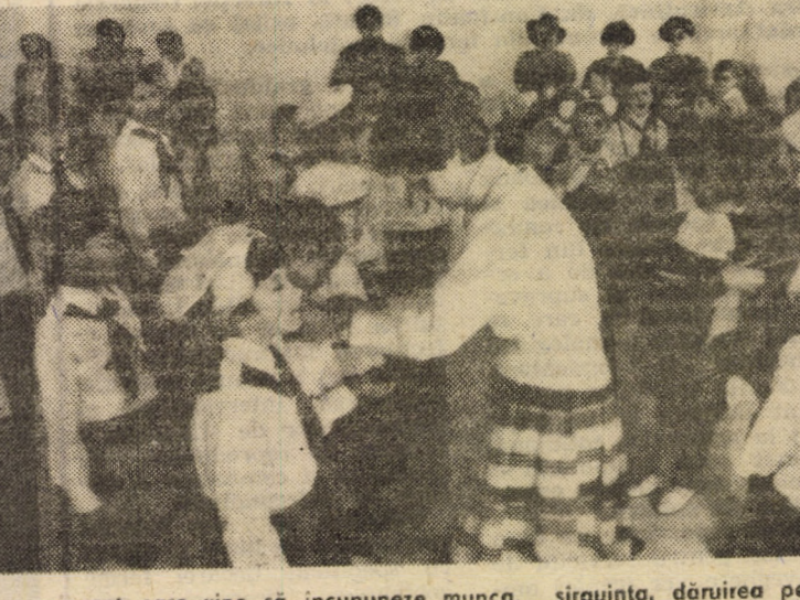
Primirea în Organizația Pionierilor constituie un unic și înălțător moment care vine să încununeze munca, sirguința, dăruirea pe care o depun în activitatea lor cele mai tinere vîrstare ale patriei. Elevii claselor a II-a din Școala Generală Nr. 5 Sibiu trăiesc cu emoție aceste clipe de neuitat, clipele pătrunderii în viața pionierească