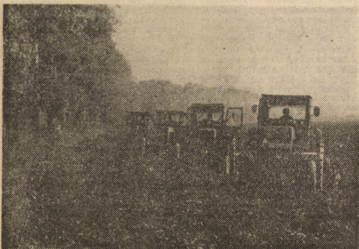
Ogoarele de toamnă sînt garanția unor producții agricole sporite