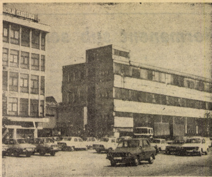
Întreprinderea „Emailul Roșu” Mediaș — unitate de prestigiu pe harta industrială a municipiului de pe Tîrnava