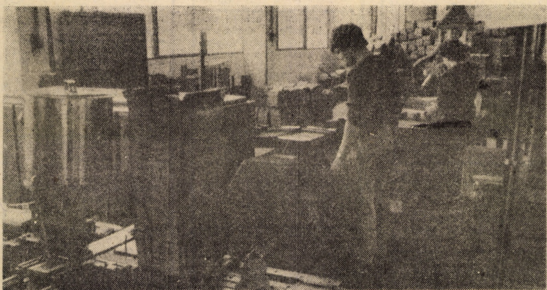
I.P.L. Sibiu, sectorul creioane. La noua linie tehnologică din atelierul prelucrări mecanice se efectuează încheierea și uscarea blocurilor pentru creioane

● Constructorii de nave din Drobeta-Turnu Severin au finalizat lucrările de montaj pe cală și au lansat la apă cel dintîi vas din planul de producție al anului viitor: șalundă maritimă autopropulsată de 600 m.c., solicitată de către beneficiari de peste hotare. Succesul este însoțit de rezultate deosebite înregistrate în realizarea sarcinilor de plan și onorarea angajamentelor, asumate în întrecerea socialistă. Astfel, în perioada parcursă din acest an, colectivul de aici a realizat o producție industrială suplimentară în valoare de 53 milioane lei și a depășit cu aproape 30 de procente planul la export, ca urmare a creșterii productivității muncii. (Agerpres)