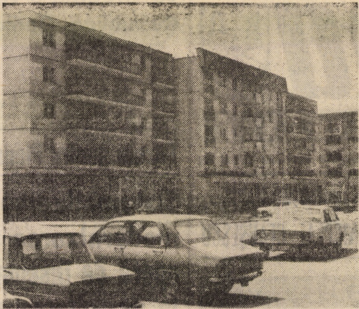
Din peisajul citadin al cartierului Ștrand din Sibiu