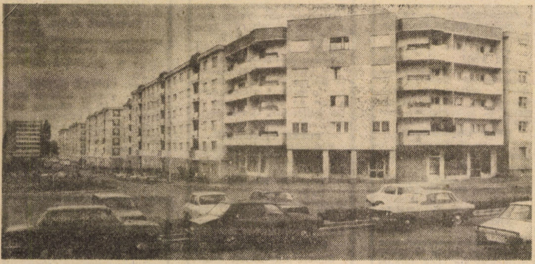
Sibiul zilelor noastre. Noile blocuri de locuințe, ridicate cu cîțiva ani în urmă, pe strada Școala de inot, se integrează armonios în peisajul arhitectonic al municipiului.

Cînd națiunea română din Transilvania s-a manifestat liberă a decis înlăturarea Marii Uniri prin actul profund democratic de la 1 Decembrie 1918 de la Alba Iulia, pe baza principiului de autodeterminare și liberă dispunere a popoarelor, unire recunoscută prin tratatele de pace și de către opinia publică internațională. Statul unitar român este o realitate pe care anii grei ai celui de-al doilea război mondial au încercat s-o pună la îndoială, dar n-au putut-o înlătura, episodul 1940—1944, în ce privește nord-estul Transilvaniei făcut cadou de Hitler credinciosului său aliat, Ungaria horthystă, rămînd un incident trist al istoriei, care nu se mai poate repeta.