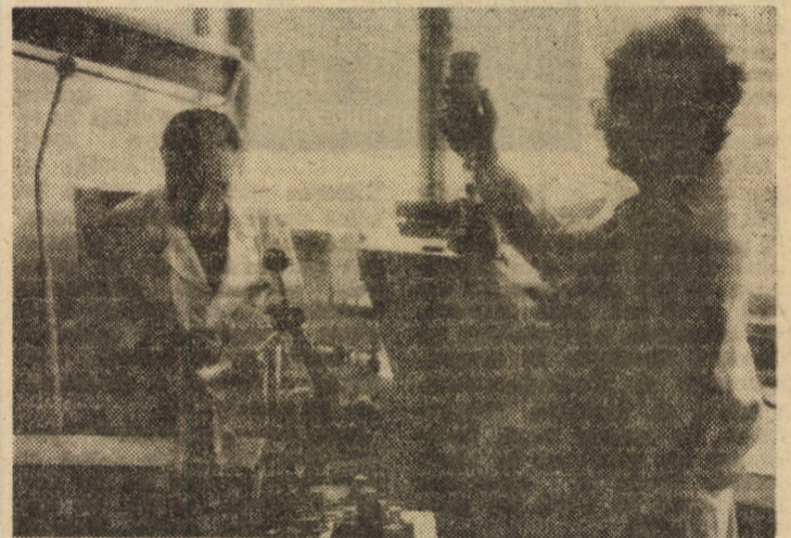
În vederea prevenirii unor boli infecțioase și metabolice, la compartimentul de microproducție al Inspectoratului Sanitar Veterinar Județean Sibiu se prepară diferite produse biologice