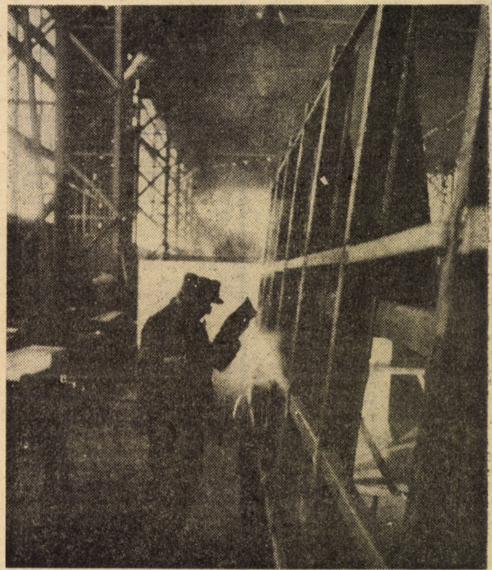
Asamblarea infrastructurilor pentru diferite autospeciale în atelierul de sudură-montaj al Fabricii Metalurgică Sibiu

treprinderea noastră se situează pe locul I în întrecerea socialistă desfășurată în acest an între unitățile din domeniul extracției țiteiului și gazului metan. Sintem pe deplin conștienți de însemnătatea rezultatelor muncii noastre pentru economia națională. Amploarea din ce în ce mai accentuată conferită extracției gazelor naturale ne obligă și pe noi să activăm, în acest domeniu vital al economiei naționale, cu responsabilitate considerabil sporită, cu profesionalism, abnegație și dăruire pentru identificarea și aplicarea celor mai eficiente soluții de organizare și modernizare a tehnologiilor de extracție a gazului metan, de promovare fermă a factorilor intensivi, calitativi și de eficiență a activității noastre. Vom face totul pentru realizarea exemplară a acestor sarcini de prim-ordin pentru dinamizarea dezvoltării multilaterale a patriei”.