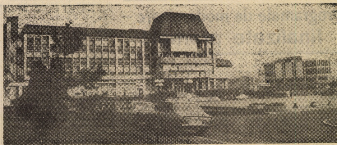
Imagine din centrul municipiului Mediaș

19,00 19,25 varășu Ceaușe buție la val și pra voltar sociali țific. — pr tare. înaltul progra și acț nară a întreg dezvol co-soci 20,10 de im 20,40 fi cet niei S Din r patriei stinse. răspun că, re tineret viitoru 21,30 bită ta jurnal rea pr