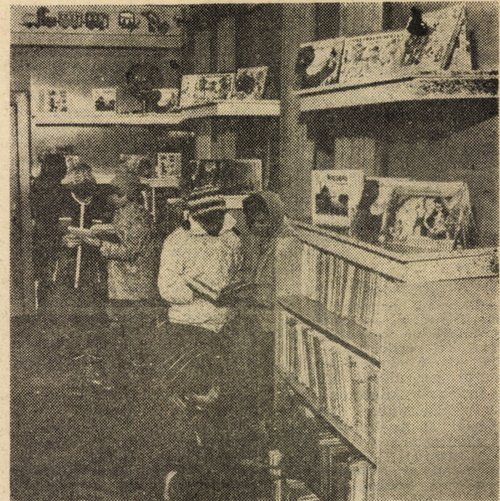
Secvență dintr-o încăpere a Secției pentru copii și tineret a Bibliotecii Municipale Mediaș, cu acces liber la raft. Micii vizitatori au la dispoziție un impresionant număr de cărți, printre altele lectură pentru preșcolari și pentru elevii claselor I-X