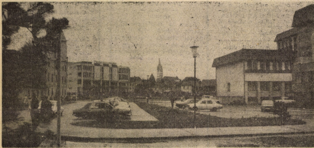
Vedere din noul centru civic al municipiului Mediaș

Conturînd așadar cu claritate și înaltă rigoare științifică sensurile și semnificațiile majore ale devenirii noastre comuniste, monumentala Expunere a tovarășului Nicolae Ceaușescu însuflețite azi întreaga națiune română. Determină și amplifică un amplu și complex proces de formare a omului nou, bine instruit, bine pregătit, cu un larg orizont de cunoaștere, cu o largă și permanentă deschidere spre nou, spre progres, capabil să participe responsabil, conștient, multilateral, la măretele obiective ale dezvoltării României socialiste, capabil în același timp să aibă un punct de vedere politic, teoretic, științific, despre lumea în care trăiește și muncește.