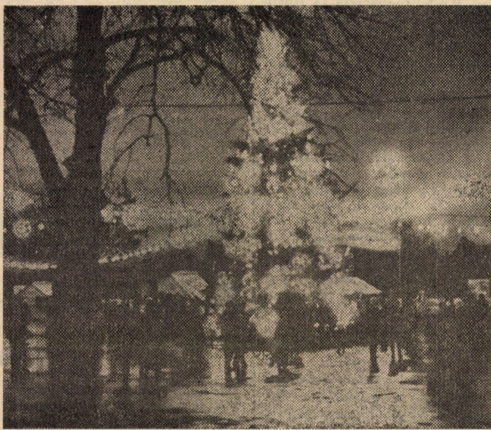
Prin intermediul acestei imagini fotoreporterul nostru Fred Nuss vă invită în Orașelul copiilor, recent deschis în Piața Unirii din Sibiu