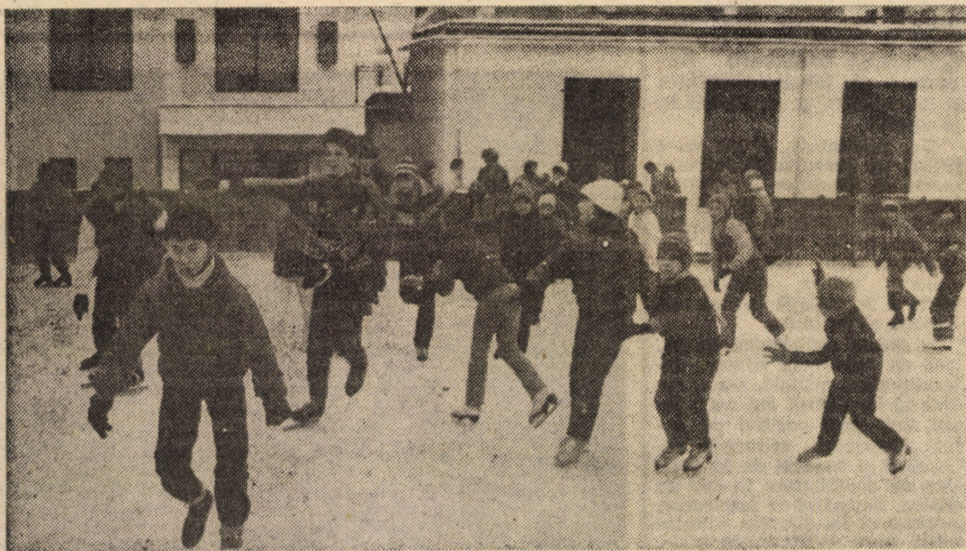
Patinoarul Tineretului — una din marile bucurii ale actualei vacanțe de iarnă