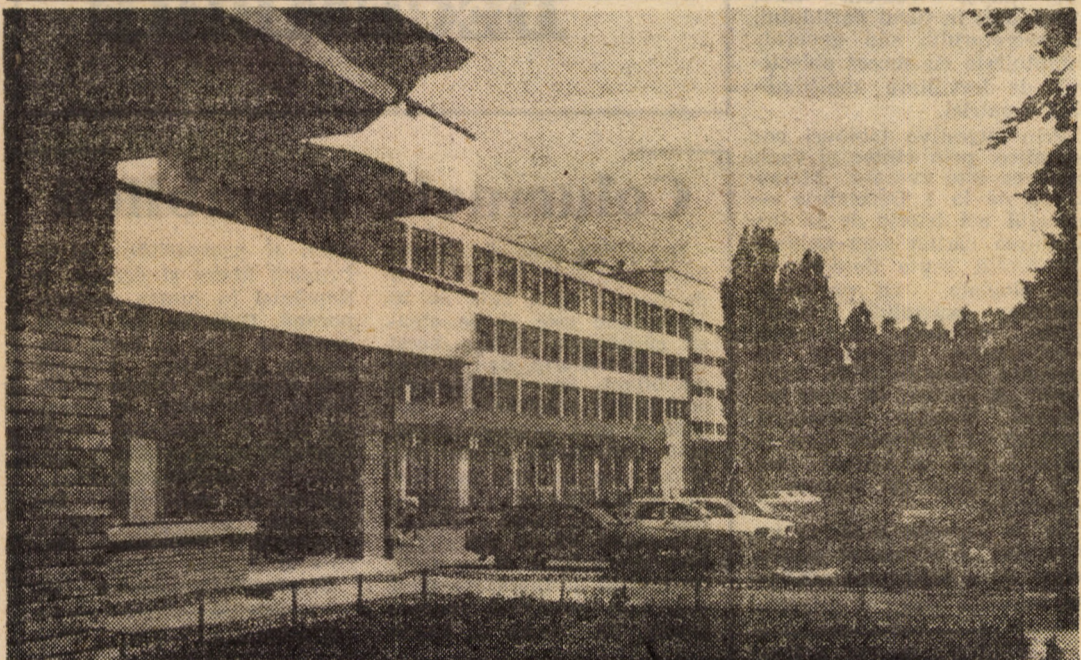
Printre ctitoriile „EPOCII NICOLAE CEAUȘESCU” ridicată în ultimele două decenii în municipiul Sibiu figurează și binecunoscuta întreprindere „Steaua Roșie”, recomandată de produsele sale de bună calitate atât în țară cât și peste hotare.

Tinerii colindători au fost invitați, apoi, în sediul Comitetului Central, unde le-au fost oferite daruri de Anul Nou.