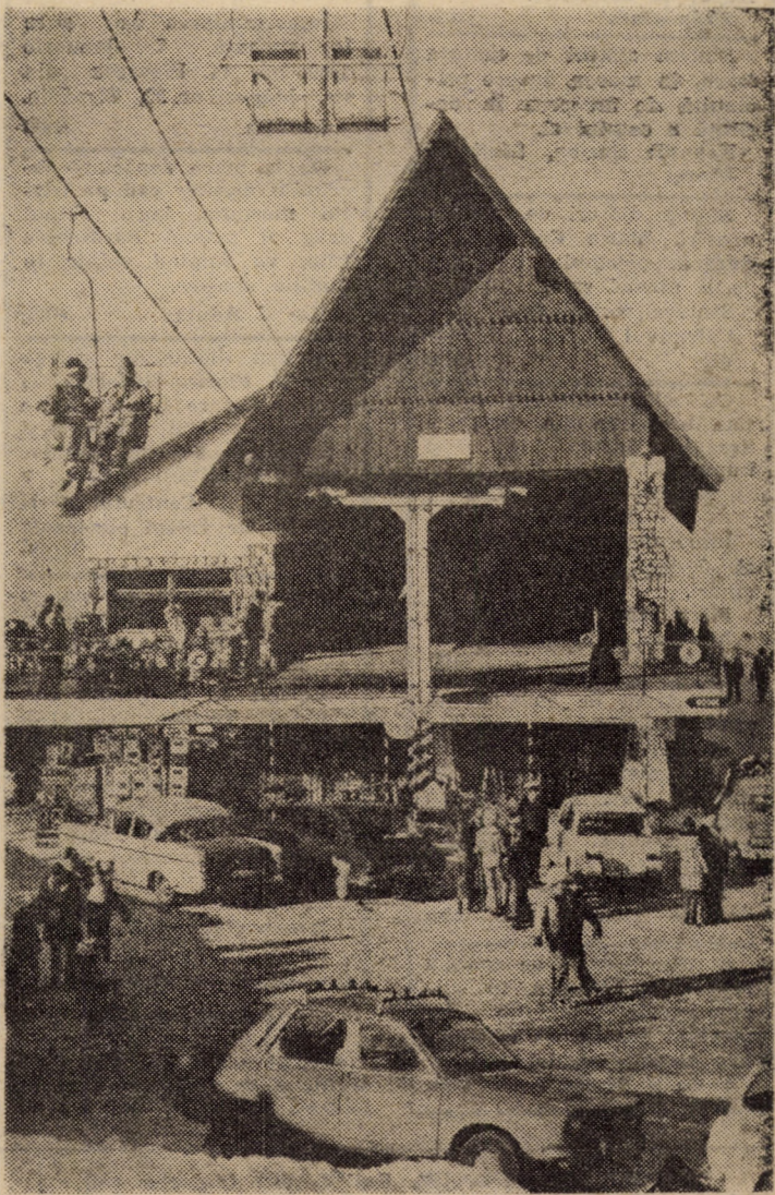
Amenajări moderne, peisaj mirific, locul ideal de agreement acum iarna la... Păltiniș

de 1 400 locuri de cazare. Între proiecte figurează construirea a două noi complexe hoteliere (cu piscină, saună, bowling, sală de sport, terenuri multifuncționale etc.); construirea a două blocuri cu 24 de apartamente pentru personalul stațiunii; construirea unei grădinițe care să dispună și de clasă I-IV, pentru schiori de performanță ș.a.m.d. Sint, fără îndoială, proiecte ambițioase, de mare necesitate, care pot ridica bătrînul Păltiniș la nivelul de confort pretins de dezvoltarea accelerată a întregii țări.