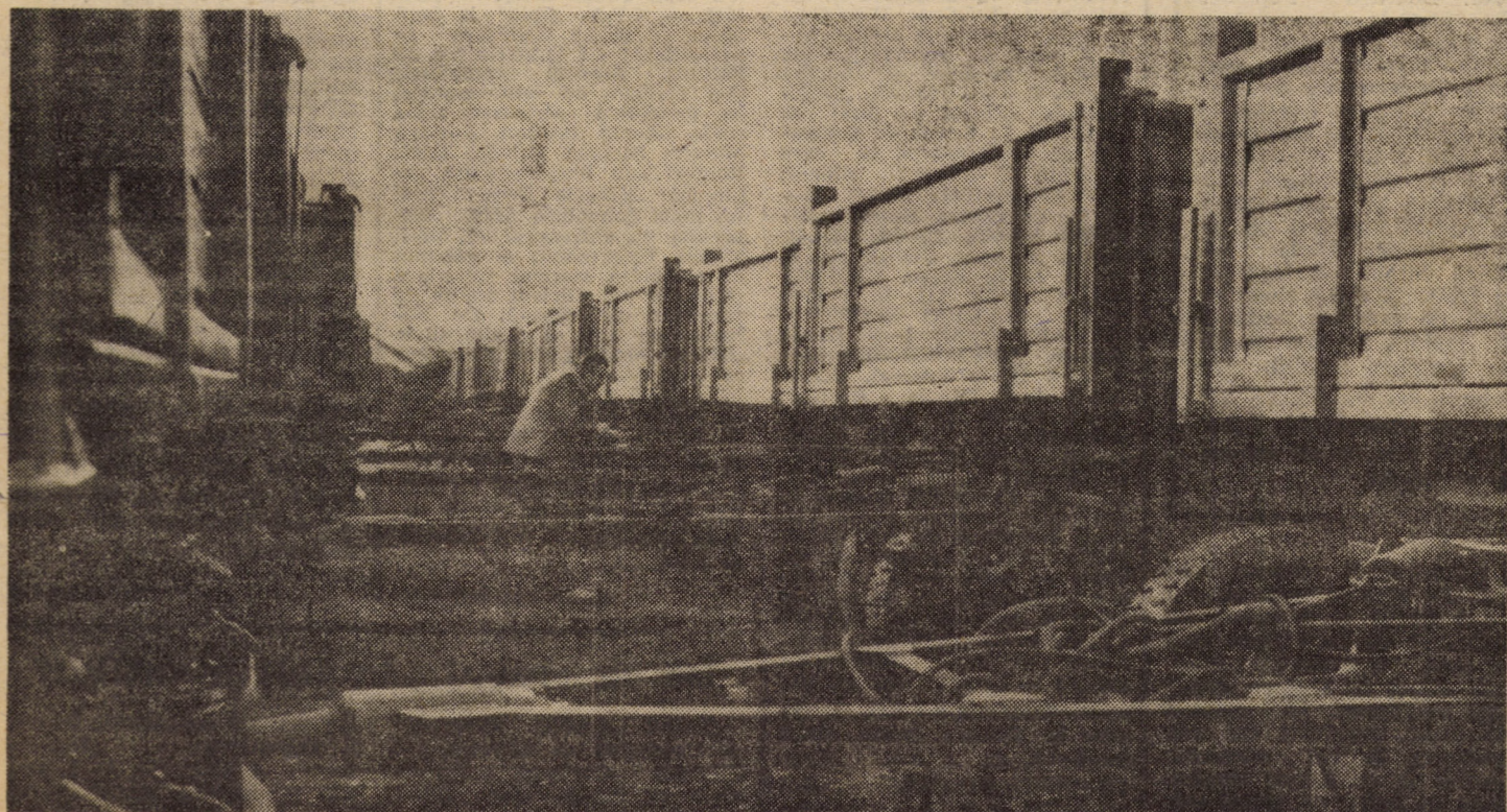
Vă redăm în imaginea de la „Metalurgica” Sibiu un nou lot de remorci basculante pe 3 părți, de 6,3 tone, destinate agriculturii și gata pentru expediție.