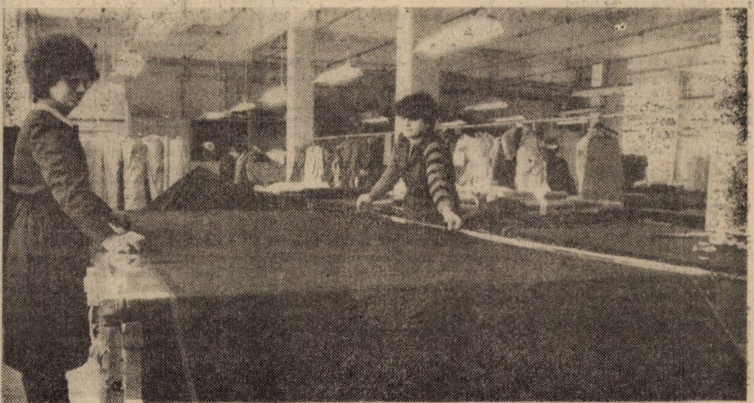
Întreprinderea de Confecții „Steaua Roșie” Sibiu. Secvență de muncă de la pregătirea fabricației.

În prezent, Comitetul de partid este preocupat pentru îmbunătățirea structurii organizatorice, impusă și de darea în exploatare a noii fabrici de pline din Hipodrom, urmărindu-se crearea unor condiții tot mai bune desfășurării muncii politico-organizatorice și educative, inclusiv a activității de întărire numerică și calitativă a rândurilor partidului. Am desprins, ca o concluzie definitivă, hotărîrea comitetului de partid de a acționa, pornind de la recunoașterea existenței unor neajunsuri și deficiențe, a necesității eliminării lor, pentru a ridica la un nivel tot mai înalt această importantă latură a muncii de partid, ceea ce va determina, cu siguranță, desfășurarea în condiții tot mai bune a activității politice, economice și sociale din această întreprindere, în acest an jubiliar, marcat de a 45-a aniversare a Eliberării și de cel de al XIV-lea Congres al partidului.