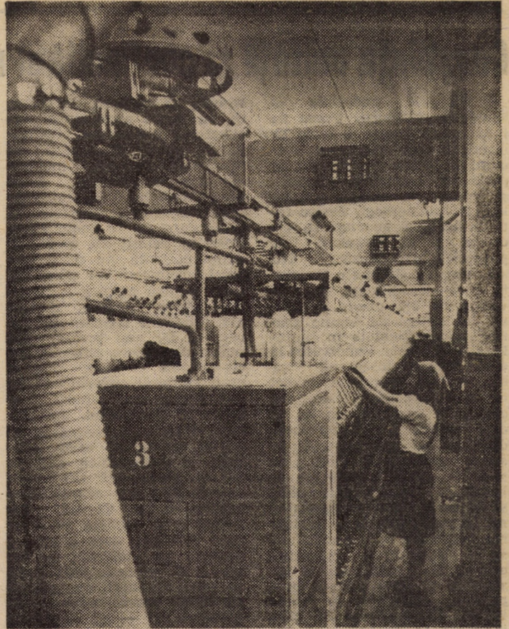
Întreprinderea „Tirnavă“ Mediaș. Preocuparea pentru calitatea produselor începe din secția filatură, la fazele de prelucrare a firelor

(Continuare în pag. a III-a) I. FLESCHIN