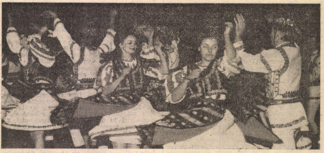
Un ansamblu folcloric de excepție „Junii Sibiului”