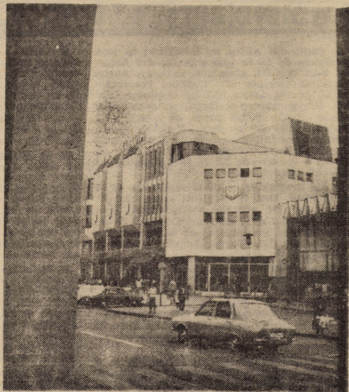
O imagine semnificativă din Mediașul zilelor noastre: Complexul comercial „Transilvania”