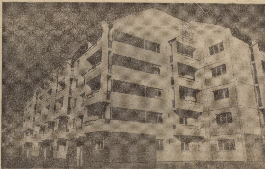
Noi construcții de locuințe ridicate pe strada Rusciorului din municipiul Sibiu