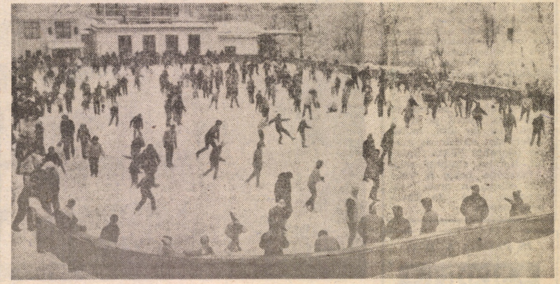
E vremea sporturilor de iarnă, așa cum ne convinge și această imagine surprinsă zilele acestea la Paștele Tineretului din Sibiu.

SÎMBĂTA, 21 ianuarie 1989 13,00 Telex. 13,05 La sfîrșit de săptămîna (c): ● Melodii populare românești ● România '89. Reportaj ● Imn în ianuarie. Moment poetic ● Baladele acestui pămînt ● Desene animate ● Recital Stela Enache ● Din Filmoteca de aur TV ● Cîntece de neuitat ● Autografe lirice. 14,45 Săptămîna politică. 15,00 Închiderea programului. 19,00 Telegurnal. 19,25 Sub tricolar, sub roșu steag. Versuri patriotice revoluționare (c). 19,40 Telegenciclopedia (c). 20,10 Baladă pentru acest pămînt. Spectacol literar-muzical (c). 20,50 Film artistic (c) — „Vulcanul stîns”. 22,20 Telegurnal. 22,30 Închiderea programului.