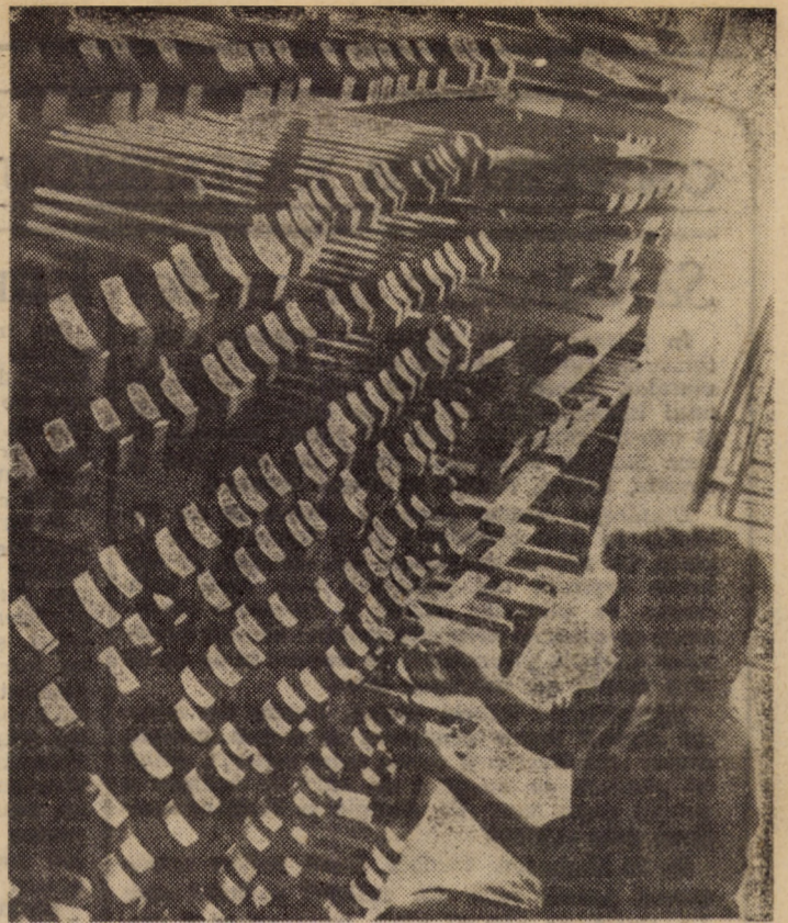
I.P.L. Sibiu, sectorul II mobilă. În imagine – componente pentru mobilă aflate în fază de finisaj

LUCEAFĂRUL SPIRITULUI ROMÂNESC (În pag. a II-a)