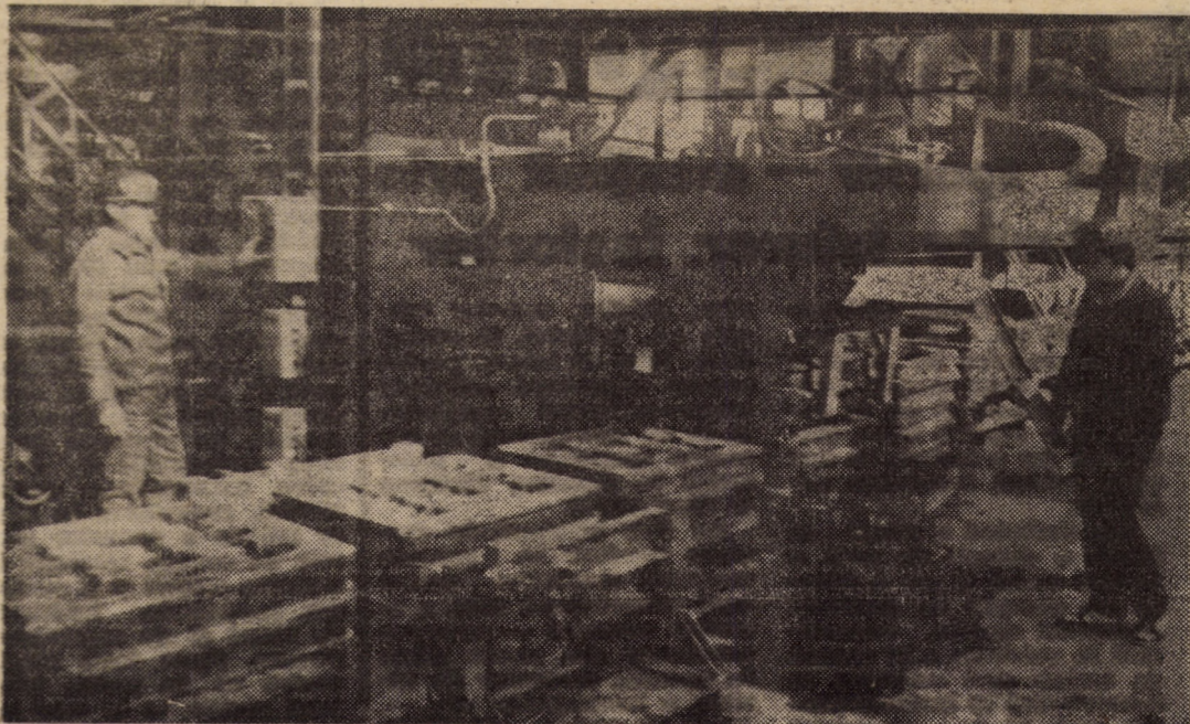
Instalații complexe, complet automatizate, din cadrul noii turnătorii a întreprinderii „Balanta” din Sibiu

(Continuare în pag. a III-a) Victor DOMȘA