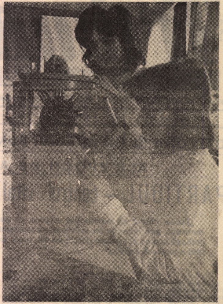
Instantaneu surprins într-unul din laboratoarele modern utilizate ale Institutului de Subingineri Sibiu