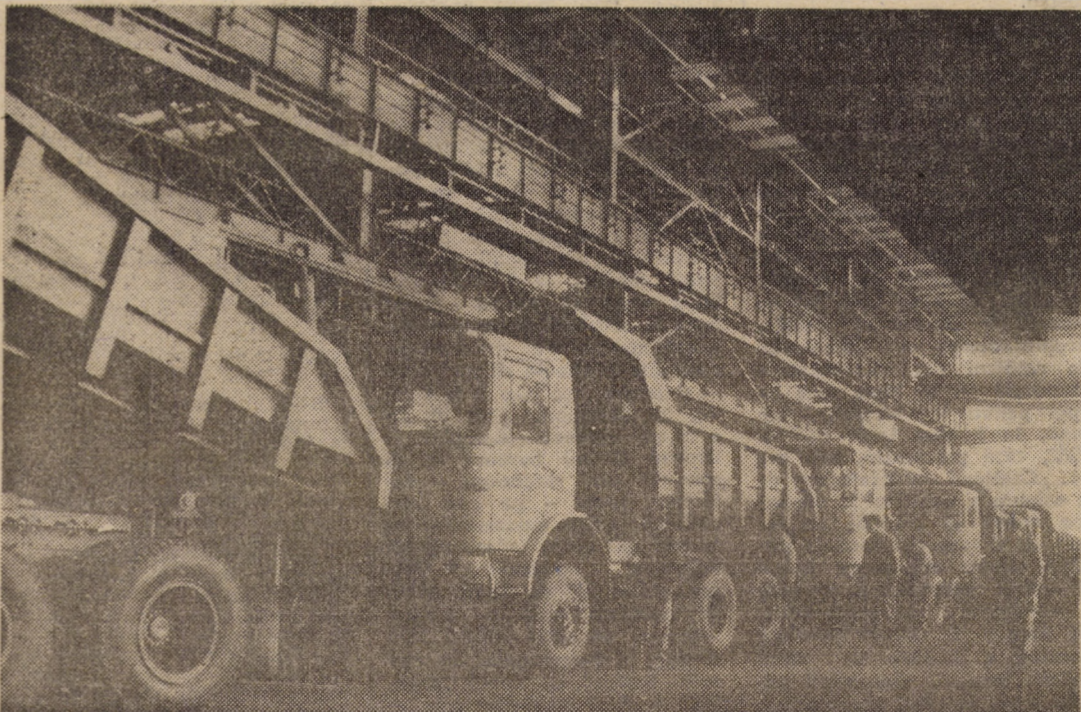
Întreprinderea Mecanică Mirșa — Hala de montaj utilaj greu, de unde vă redăm linia de producție bascule tip 16 T, mult solicitate la export