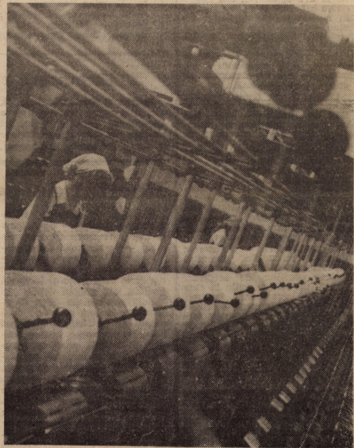
Calitatea firelor — un obiectiv urmărit cu perseverență în toate compartimentele de producție ale întreprinderii „Furul Roșu” Tălmăciu.

san Uutiset” din Finlanda. Cu acest prilej, tovarășul Nicolae Ceaușescu a acordat un interviu pentru ziarul finlandez „Kansan Uutiset”.