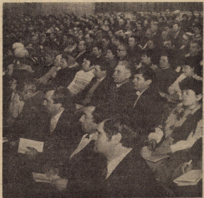
Aspect din timpul lucrărilor plenarei

În aceste momente înălțătoare, strîns uniți în jurul glorioșului nostru partid, al dumneavoastră, mult stimate și iubite tovarășe NICOLAE CEAUȘESCU, vă rugăm să ne permiteți ca acum, la puțin timp de la aniversarea zilei de naștere, să vă adresăm din adîncul inimilor, cu vibranta dragoste și prețuire, urări de viață îndelungată, multă sănătate și putere de muncă, ani mulți și luminoși, plini de satisfacții și împliniri, spre binele și prosperitatea poporului, spre înălțarea pe noi culmi de civilizație și progres a sumpetei noastre patrii — Republica Socialistă România.