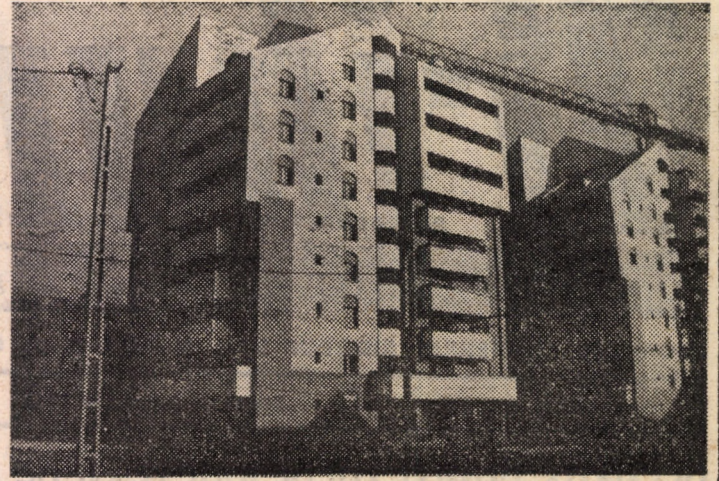
În zonele industriale ale „Orașului de jos” din Sibiu, peisajul arhitectonic se îmbogățește pe zi ce trece cu noi și îndrăznețe construcții edilitare, cum sînt și cele de pe str. N. Teclu