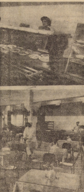
Imagini ale noului edificiu social-gospodăresc de la „13 Decembrie” Sibiu

La Racovița, după cum se vede, oamenii fac treabă bună — îndrumați competent de conducerea comunei — conștienți că pentru ei, pentru binele obștei lor se străduiesc.