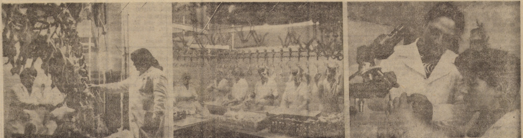
Abatorul de păsări Mîrșa — Aspecte ale muncii din noile hale modernizate

79,5 la sută la carne de pasăre și 55,4 la carne de iepure. Aci se pregătesc 21 sortimente din carne de pasăre și 6 din carne de iepure. Și un fapt cu totul deosebit: în luna ianuarie 1989 a fost înregistrată cea mai mare producție industrială din istoria de 8 ani a abatorului, livrîndu-se, astfel, la fondul pieții, peste plan, însemnate cantități de produse.