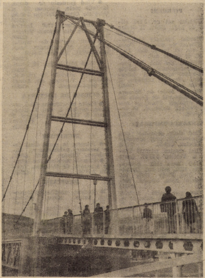
Pasarela peste riul Tîrnava. Unul din obiectivele de interes cetățenesc realizat în ultimii ani în municipiul Medias

Așadar, în perioada ce a mai rămas pînă la oprirea liniei, eforturile vor fi concentrate în direcția soluționării ultimelor probleme aflate încă sub semnul întrebării. Întreg colectivul este pe deplin conștient că de reușita acestei acțiuni depind hotărâtor și realizările în producție pe întregul an.