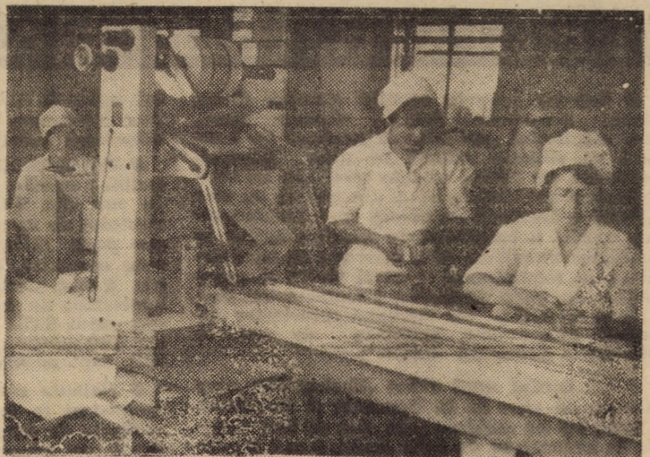
Linie de ambalat napolitane la Întreprinderea „Victoria” din Sibiu

În spiritul valoroaselor teze, idei și orientări cuprinse în magistrala Expunere a secretarului general al partidului, plenara a adoptat un cuprinzător plan de măsuri politico-organizatorice și educative, în vederea perfecționării întregii activități, obținerea unor rezultate tot mai bune, întîmpinării marilor evenimente din acest an din viața partidului și patriei cu noi și remarcabile fapte de muncă.