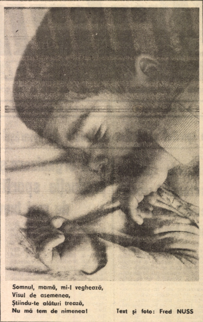
Somnul, mamă, mi-l veghează, Visul de asemenea, Știindu-te alături trează, Nu mă tem de nimenea!

P.S. Desigur, răzbătători și perseverenți cum prea bine îi știe lumea, vor apuca drumurile instanțelor de apel, hotărîrea primei instanțe fiind „cu drept de apel în 3 zile de la pronunțare. (Lector).