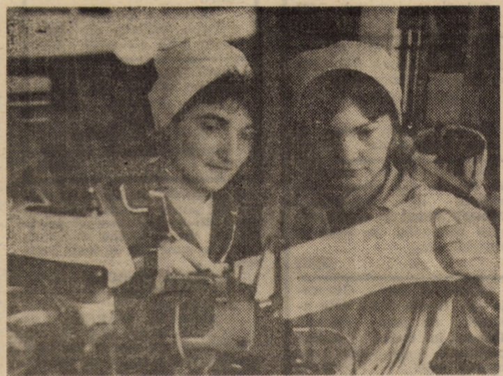
O bună pregătire teoretică și practică, exigență pentru calitatea produselor realizate, — iată câteva atribuții dobîndite de elevii Liceului Textil „7 Noiembrie” Sibiu

Comitetul Politic Executiv a soluționat, de asemenea, probleme curente ale activității de partid și de stat.