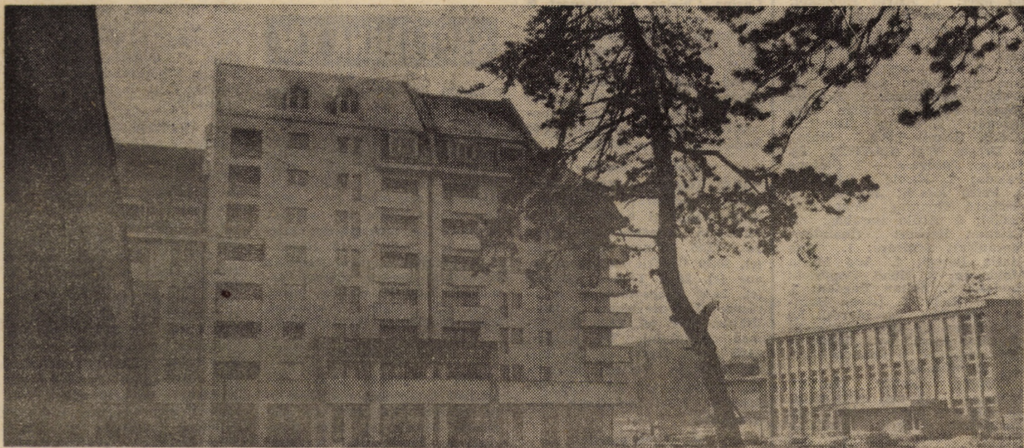
Noi construcții din cartierul Tineretului, Sibiu

În completarea acestei acțiuni politice și cultural-educative, Fanfara oamenilor muncii de naționalitate germană din Sibiu, dirijată de profesorul Wilhelm Stimer, va susține un program artistic.