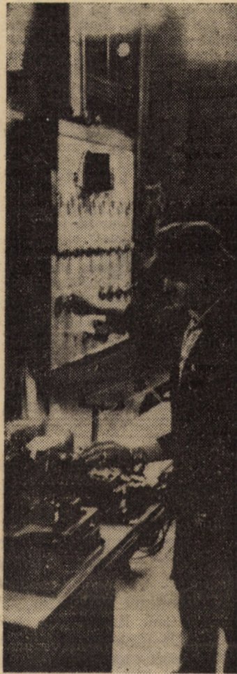
Colectivul Întreprinderii „Flamura Roșie” se preocupă pentru realizarea indicilor de calitate ai produselor. Vă redăm un aspect de muncă din atelierul metal