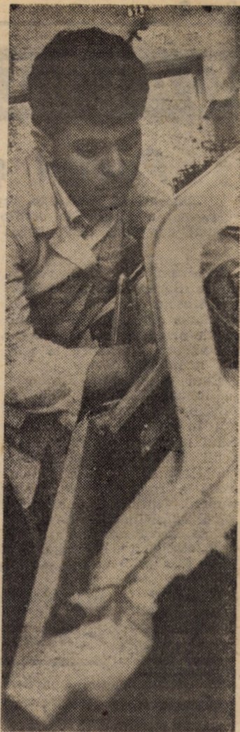
Studierea mecanismelor, a modului optim de funcționare și a multiplelor posibilități de exploatare a mașinilor rectilunii de tricatat în atelierul-școală al Liceului textil „7 Noiembrie” Sibiu

ORGAN AL COMITETULUI JUDEȚEAN SIBIU AL P.C.R. ȘI AL CONSILIULUI POPULAR JUDEȚEAN