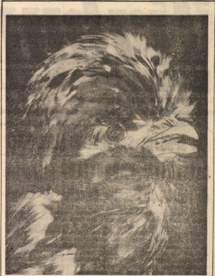
O spun cu glas convingător Pe-adresa găinușelor: Penajul meu atrăgător n-are nevoie de... coafor!

● Poliția din Torino l-a arestat pe proprietarul barului „Marilyn Pub” care clienților — aleși pe sprinceană — le oferea „specialitatea casei”: plăcinta cu... cocaină. Ce le mai trece unora prin minte! ● În Suedia, unde numărul celor bolnavi de SIDA a ajuns la 6000, s-a creat primul „lagăr” în care vor fi izolați 10 bărbați și femei suferinzi, pentru... studiu. Dar ce se întâmplă cu ceilalți 5990? ● În Anglia trăiesc 7 familii de miliardari și vreo 20000 de milionari. Puțini dintre componenții acestor clanuri (circa 5 la sută) au și diplome atestând studii superioare. Dacă „fac” bani, școală ce le mai trebuie? ● Un studiu publicat în S.U.A. relevă că peste 27 de milioane de americani care au depășit vârsta de 17 ani, nu știu să scrie și să citească. S-auzi și să nu crezi! ● În R. P. Chineză există 3501 cetățeni în vîrstă de 100—109 ani, 209 avînd între 110 și 119 ani și 36 care depășesc vârsta de 120 ani. Majoritatea lor trăiesc în mediul rural. Concluzia: dacă vreți să trăiți mult, întoarceți-vă în satul natal! ● Anual numai în Europa mor circa 500000 de oameni din cauza fumăturii. Da, va ricana fumătorii dar numărul fumătorilor care nu mor este mult mai mare... (n.i.d.)