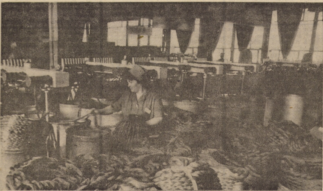
Întreprinderea „Libertatea” Sibiu. Vă redăm o imagine parțială din secția prepararea filaturii. În prim plan: unul din laminoarele de mare întindere

În ceea ce privește unitățile industriale, acestora li s-a trasat ca sarcină de prim ordin realizarea de surse proprii — puțuri sau prize de mal pe rîurile și pîraiele care au debit suficient pentru aceasta. Acțiunea este în curs și o serie de unități ca I.L.F. Sibiu și „FLARO” și-au dat în exploatare fîntînile, iar întreprinderile Steaua — săpun, „13 Decembrie” și „Drapelul Roșu” acționează pentru forarea de puțuri care să le asigure necesarul de apă industrială.