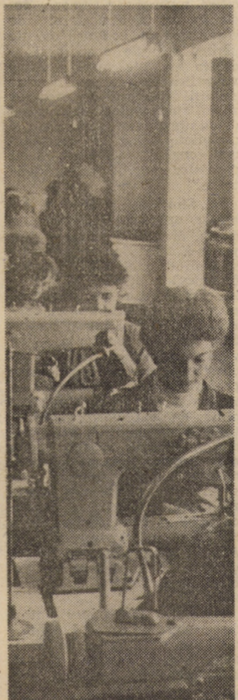
Secvență de lucru la o linie de confecționat articole de marochinărie într-unul din atelierele Cooperativei „Gheata” din Sibiu

(Continuare în pag. a III-a) Sorin GIURGIU, hidrolog la O.G.A. Sibiu