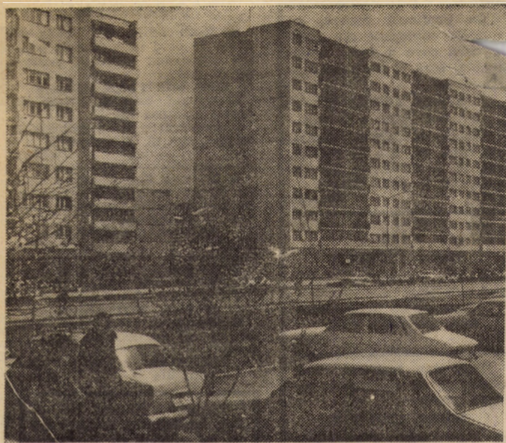
Sibiul zilelor noastre. B-dul M. Viteazul din cartierul Hipodrom