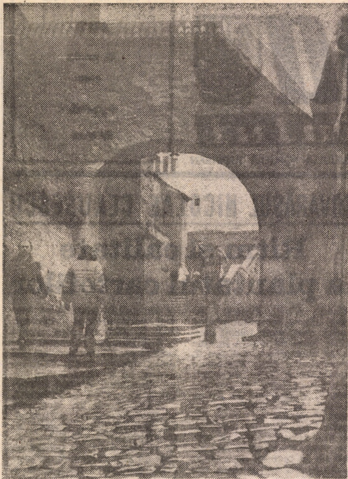
Pasajul scîrilor — drum de acces spre „orașul de sus“ al Sibiului