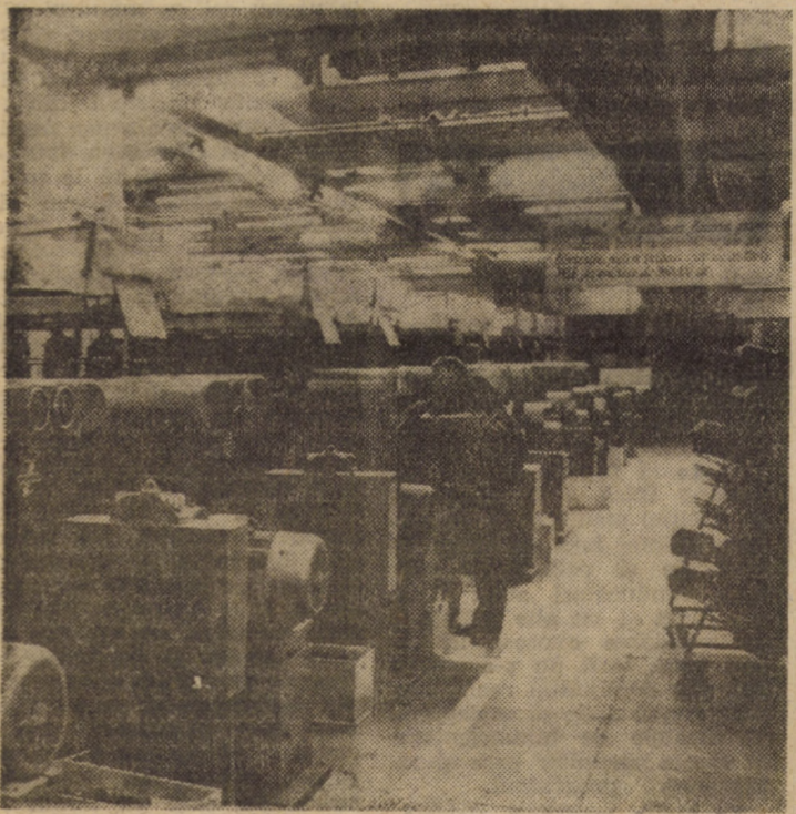
Vedere parțială din secția filatură a Întreprinderii „Libertea” Sibiu — firmă de prestigiu, recunoscută pe plan internațional datorită calității produselor sale.