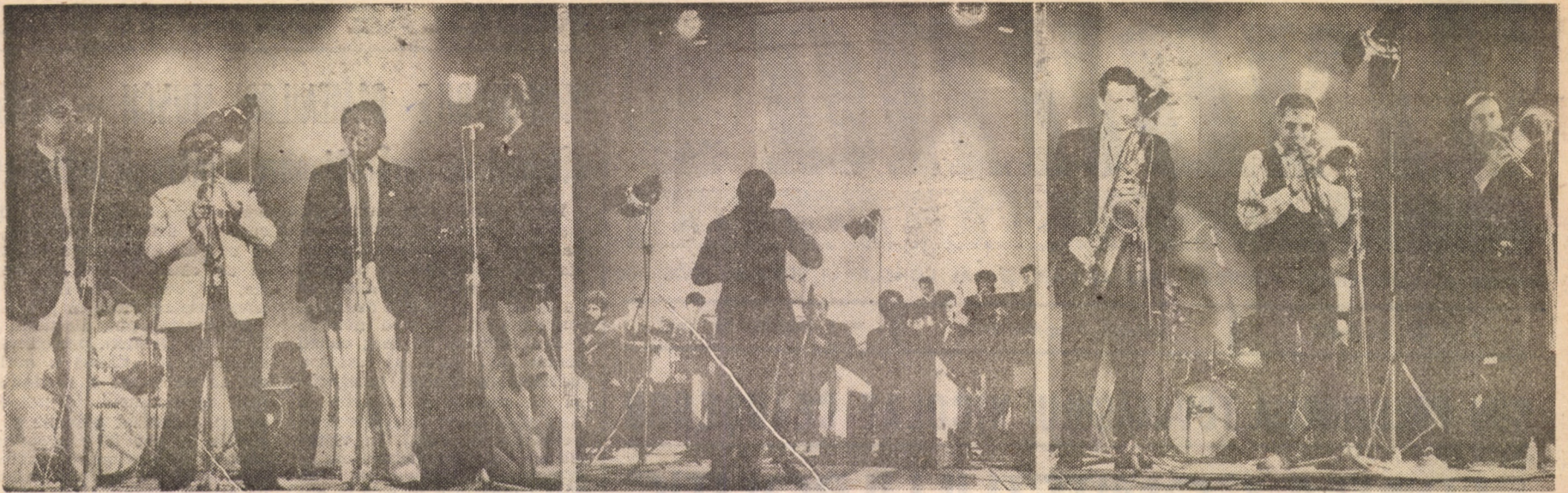
Imagini din cea de-a II-a seară a prodigioasei manifestări „Zilele jazzului sibian”