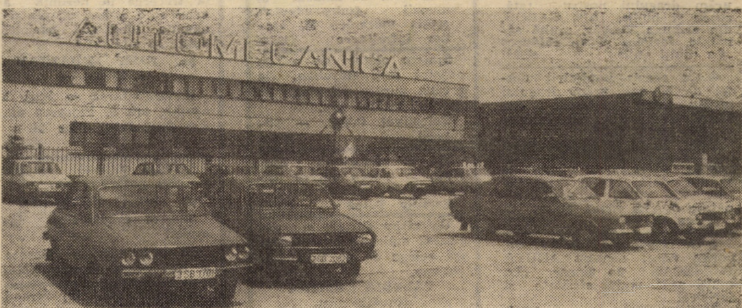
„Automecanica” Mediaș — prestigioasă unitate industrială a municipiului de pe Tîrnava care a cunoscut ample modernizări in cursul „Epocei Nicolae Ceaușescu”