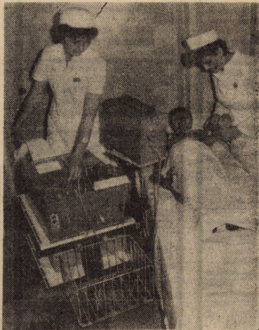
Grija neostoită pentru sănătatea copiilor noștri, o luptă generoasă încheiată cu succese remarcabile ale oamenilor în halate albe. În imagine, aspecte din cabinetul de explorări funcționale al Spitalului de copii Sibiu

Sănătatea este problema noastră, a tuturor, interesînd întreaga omenire. Să vorbim despre ea, să știm să o apărăm și să o promovăm. Deci, "Să discutăm despre sănătate", reprezintă o chemare plină de generozitate și umanism, sub semnul căreia se sărbătorește în acest an "Ziua Sănătății".