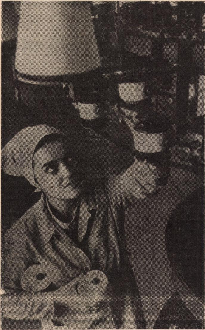
Practică productivă în atelierul-școală al Liceului textil „7 Noiembrie” Sibiu