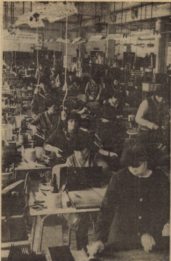
Harnicul colectiv al oamenilor muncii de la Întreprinderea "13 Decembrie" Sibiu întâmpină ziua de 1 Mai cu noi și noi succese