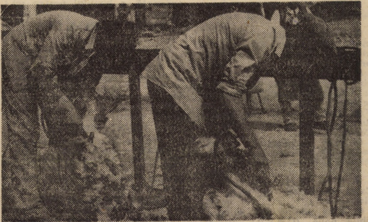
C.A.P. Alțina, ferma zootehnică. Un aspect de muncă de la tunsul oilor

Seara tîrziu, la sediul consiliului unic, a avut loc o analiză a modului în care s-a acționat în cursul zilei. Cu acest prilej s-au stabilit măsuri pentru menținerea ritmului bun atîns la semănatul porumbului (221 ha/zi), ceea ce creează condiții pentru finalizarea acestei lucrări pînă la sfîrșitul săptămîinii în curs. Totodată, s-a cerut începerea semănatului porumbului pentru siloz, precum și intensificarea lucrărilor din legumicultură. În zootehnie, eforturile se cer îndreptate spre creșterea producțiilor animale, în principal pe seama introducerii în hrana animalelor a secarei masă verde.