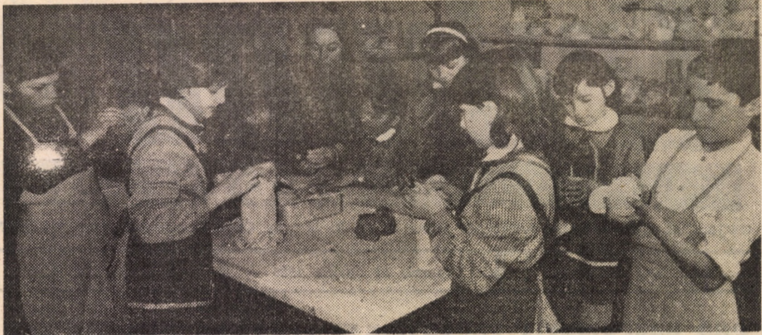
Cercul de ceramică al Casei Pionierilor și Șoimilor Patriei Sibiu, condus de Vasilica Moldovan, reprezintă mereu un punct de atracție pentru micii creatori, chiar și pe timpul vacanței