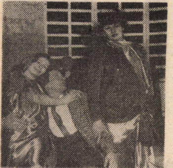
Teatrul de Stat Oradea. „Cum se cuceresc bărbații”

Teatrul de Stat din Oradea va prezenta pentru publicul sibian sîmbătă, 22 aprilie, orele 17 și 19,30, în sala Teatrului de Stat din Sibiu, comedia de mare succes „Cum se cuceresc bărbații” de W. S. Maugham, realizată în două părți, după o traducere de Andrei Bartheș. Regia spectacolului este semnată de Ștefan Farkas, iar scenografia de Maria Hațeganu.