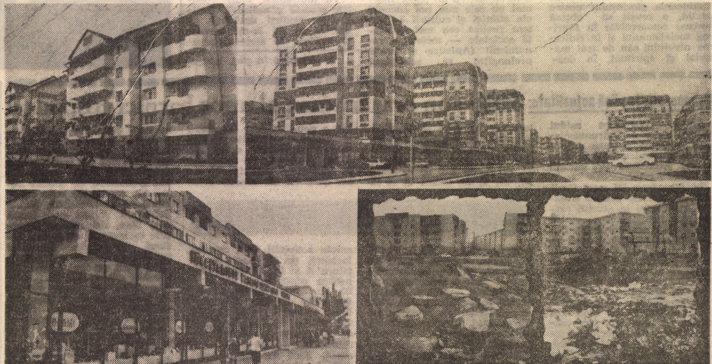
Cel mai tînar cartier al Sibiului „Valea Aurie” își pune prin harnicia locuitorilor săi o serioasă candidatură la un loc fruntaș în acțiunile de înfrumusețare și bună gospodărire (imaginile de sus); Disonanțe nedorite în cartierul Ștrand... față în față (imaginile de jos)

„Luna curățeniei” continuă. În fapt, însă, luna aceasta trebuie să dureze 12 luni dintr-un an. Este cel mai frumos și responsabil răspuns pe care cetățenii și municipalitatea îl pot da minunatelor condiții de viață create oamenilor muncii în anii socialismului, cu precădere în perioada care a trecut de la Congresul al IX-lea al partidului.