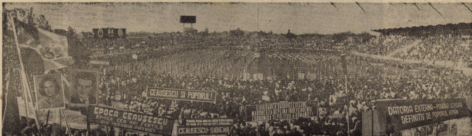
Aspect de la Adunarea populară desfășurată pe stadionul „Municipal”